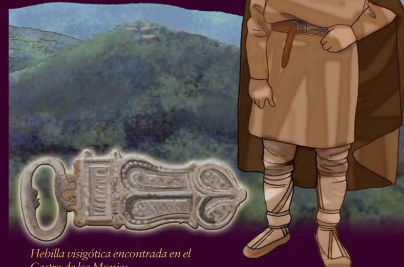
Hebillas visigóticas encontradas en el Castro de los Monjes

10 VECINOS DEL AYER. Si miras el paisaje con atención verás en un cerro frente a ti la zona denominada del castillo donde se encuentra un antiguo castro berón del siglo V a.c. que consta de cuatro murallas escalonadas aprovechando la orografía del terreno, y donde se han hallado gran número de objetos de uso cotidiano como puntas de flechas, monedas y broches, usados por aquellos primeros pobladores que dieron nombre a esta sierra: ( Cam = Tierra, Beros= Beron ).