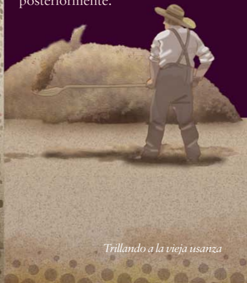
Trillando a la vieja usanza

6 EL VIENTO COMO HERRAMIENTA. Seguro que en este lugar notas una ligera brisa; hasta hace bien poco ha sido herramienta fundamental para la obtención de cereal. El proceso se desarrollaba en estas eras: primero, la trilla, esparciendo los atados de cereal y pisándolos con ayuda del trillo ( tabla con piedras cortantes ) que iba tirado por dos animales. Después llegaba el momento de ‘ aventar ’, labor consistente en echar al aire el cereal y dejar que sea el viento quien separe y arrastre la paja para que el grano caiga al suelo y pueda ser recogido y almacenado posteriormente.