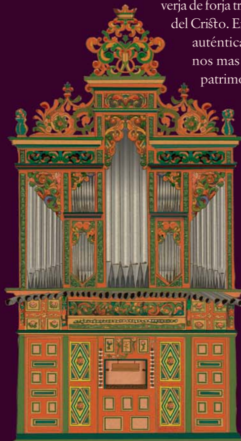
Órgano del s. XVIII.

3 SOBERBIOS ECOS BARROCOS. La iglesia de San Bartolomé pone un pórtico majestuoso a nuestro paseo. Levantada a principios del XVI y rehecha en estilo barroco un siglo después, en su exterior destaca la verja de forja traída de la antigua ermita del Cristo. En su interior alberga una auténtica joya: uno de los órganos más antiguos y valiosos del patrimonio riojano construido entre los años 1713 y 1718 por Diego de Orio en estilo barroco en el que deTaca su caja de pino adornada con tallas de motivos vegetales y los 800 tubos para la salida del aire. Interesantes también el retablo barroco de la nave central y los rocós de las laterales.