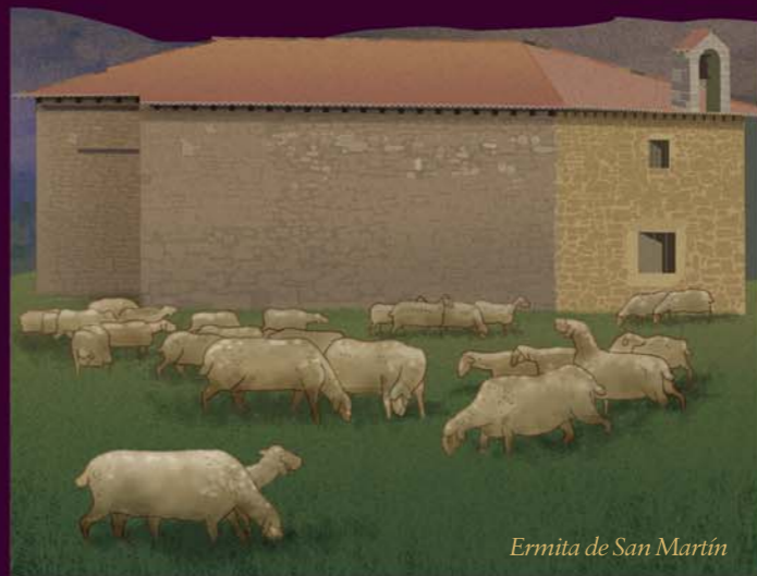
Ermita de San Martín

9 SAN MARTÍN; CONCENTRACIÓN RELIGIOSA. Ante ti tienes la ermita de San Martín edificada en el siglo XVII en estilo barroco, la cual llegó incluso a contar con un rebaño propio que pastaba en las praderas circundantes hasta el año 1732 en que la crisis lanar obligó a venderlo. Actualmente realiza una pequeña labor de asilo ya que alberga en su interior los 3 retablos e imágenes de la desaparecida iglesia de Pajares , y la imagen de San Benito que anteriormente se encontraba en la ermita que había junto al molino harinero de Lumbreras.