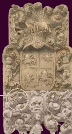
Cuernos de carnero: referencia a la riqueza ganadera

6 EL VIENTO COMO HERRAMIENTA. Seguro que en este lugar notas una ligera brisa; hasta hace bien poco ha sido herramienta fundamental para la obtención de cereal. El proceso se desarrollaba en estas eras: primero, la trilla, esparciendo los atados de cereal y pisándolos con ayuda del trillo ( tabla con piedras cortantes ) que iba tirado por dos animales. Después llegaba el momento de ‘ aventar ’, labor consistente en echar al aire el cereal y dejar que sea el viento quien separe y arrastre la paja para que el grano caiga al suelo y pueda ser recogido y almacenado posteriormente.