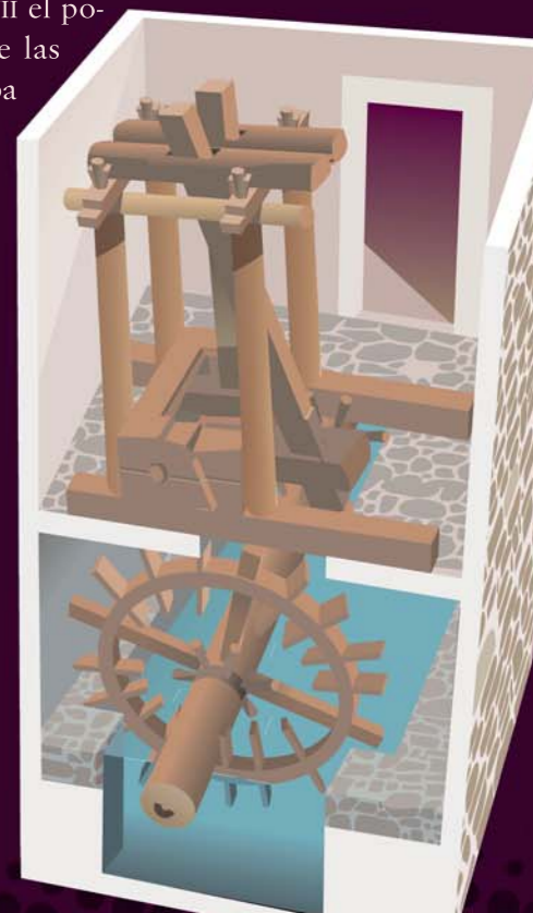
Sección de un batán

11 LA FUERZA DEL AGUA EN EL BATÁN FORJA EL BUEN PAÑO. Desde este punto oirás perfectamente el ruido de las aguas del río Piqueras y si mirás hacia abajo puedes ver las construcciones del batán de Lumbreras . Esta población vivió varios siglos de gran prosperidad gracias a su desarrollo ganadero. A mediados del siglo XVII el potencial primario de las ovejas se rentabilizaba aún más mediante la fabricación de paños y bayetas en las industrias locales, o con los lavaderos, telares y batanes, uno de los cuales puedes ver ahora, donde aprovechando la fuerza del río Piqueras se golpeaban las mantas mojadas para dejarlas listas para su uso.