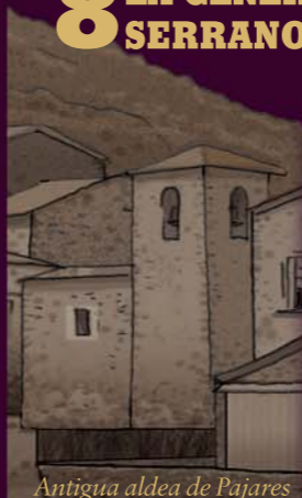
Antigua aldea de Pajares

8 LA GENEROSIDAD SOLIDARIA DE LOS SERRANOS. No todas las casas de piedra de Lumbreras albergan historias lejanas. La alineación de edificios por la que pasas, aunque imita construcciones y repite materiales tradicionales, apunta a un origen más reciente que deja patente la generosidad de los pueblos de la sierra con los del valle. Estas casas datan de finales del siglo XX y se construyeron para dar cobijo a parte de los habitantes de la aldea de Pajares , que tuvieron que despedirse de la tierra que les vio nacer un 18 de marzo de 1990, para dar lugar al embalse que desde entonces regula el río Piqueras entre Lumbreras y San Andrés.